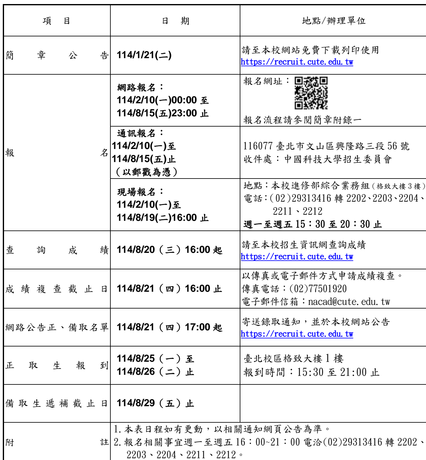
中國科技大學臺北校區 114 學年度進修部四技單獨招生重要日程表