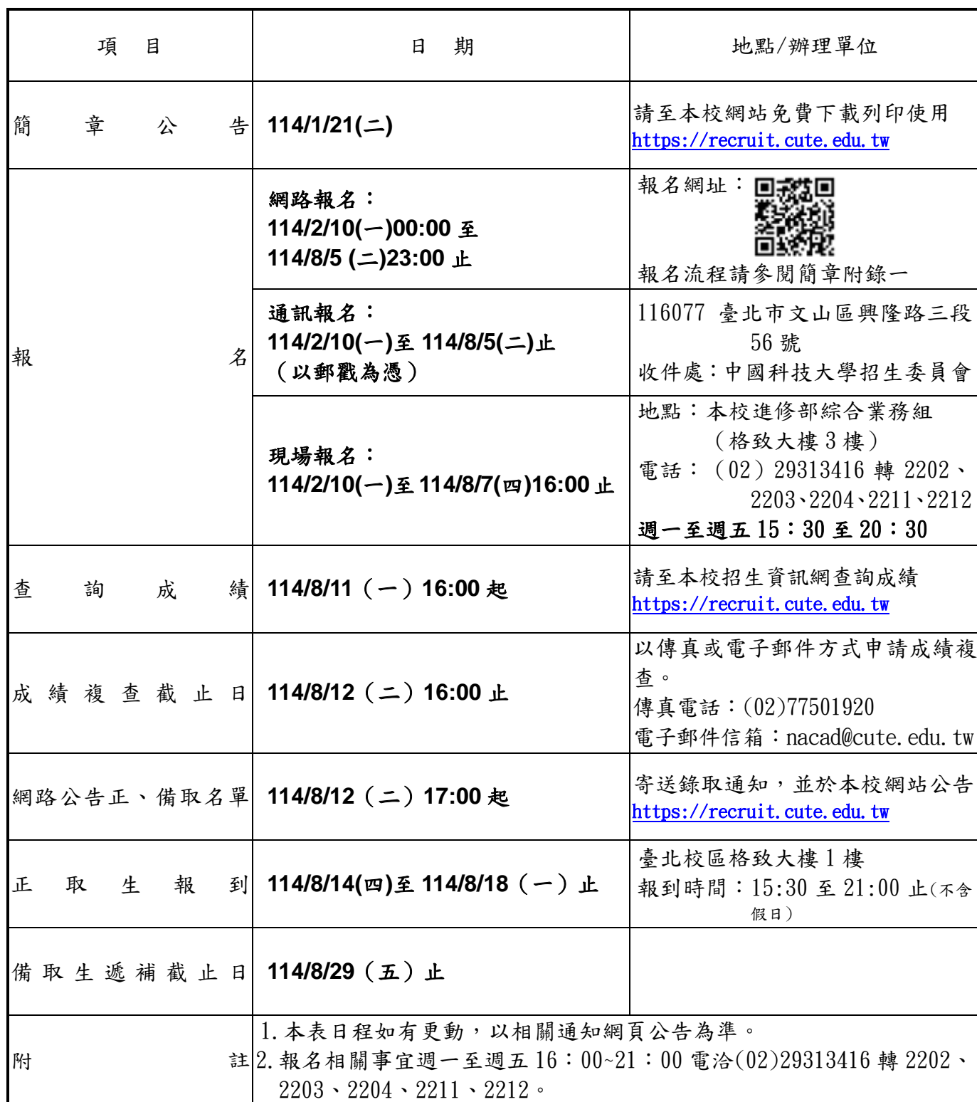
中國科技大學臺北校區 114 學年度進修部二技單獨招生重要日程表