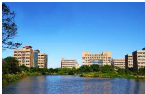
新竹校區 Hsinchu Campus