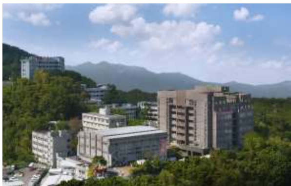
臺北校區 Taipei Campus